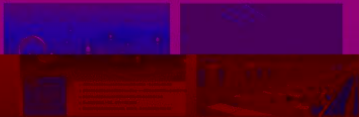
图 5-1-1 EPIP